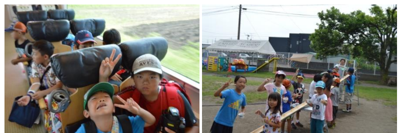
(昨年のサマースクールより)